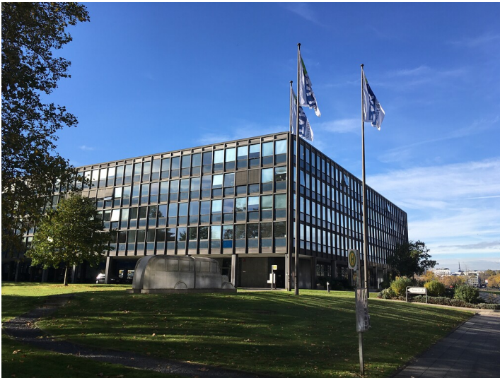
LVR-Landeshaus am Kennedy-Ufer in Köln-Deutz (2021)