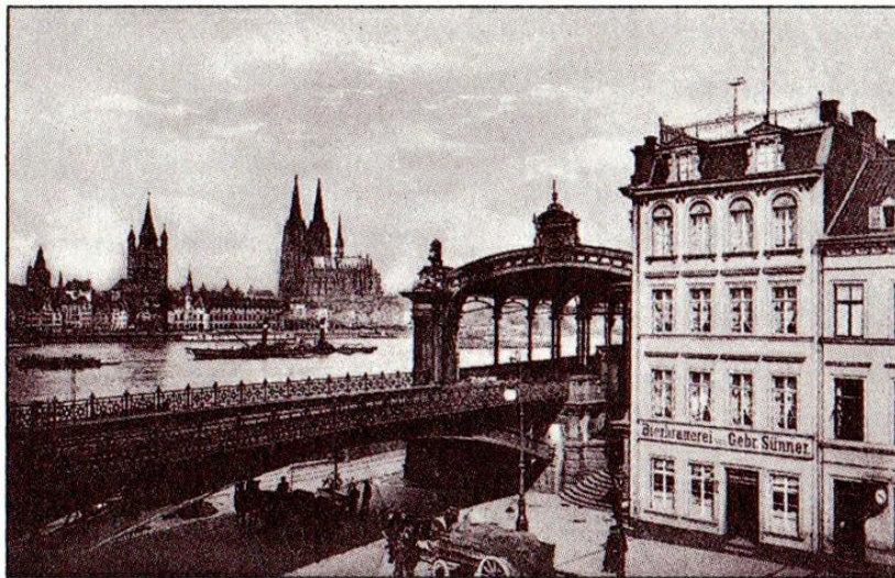
Foto-Postkarte von um 1900: Das Stammhaus der Sünner-Brauerei am "Mindener Bahnhof" der Köln-Mindener Eisenbahn in Deutz, im Hintergrund das Kölner Rheinufer mit dem Dom (aus: Zeugen Kölner Brau-Kultur 1396-1996, S. 142).