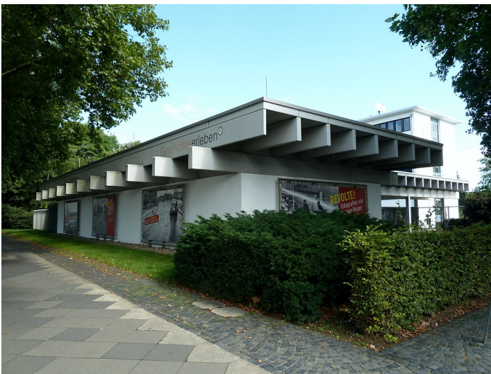
Pavillon Ecke Willy-Brandt-Allee / Welckerstraße in Bonn (2017)