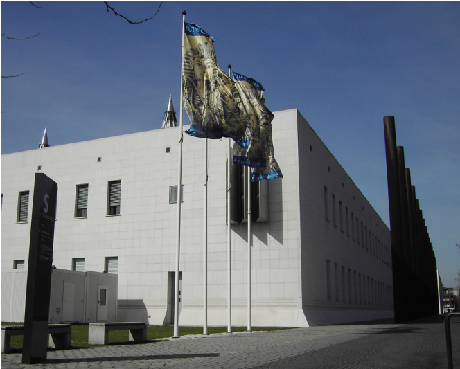
Die Kunst- und Ausstellungshalle der Bundesrepublik Deutschland, "Bundeskunsthalle" in Bonn (2005).