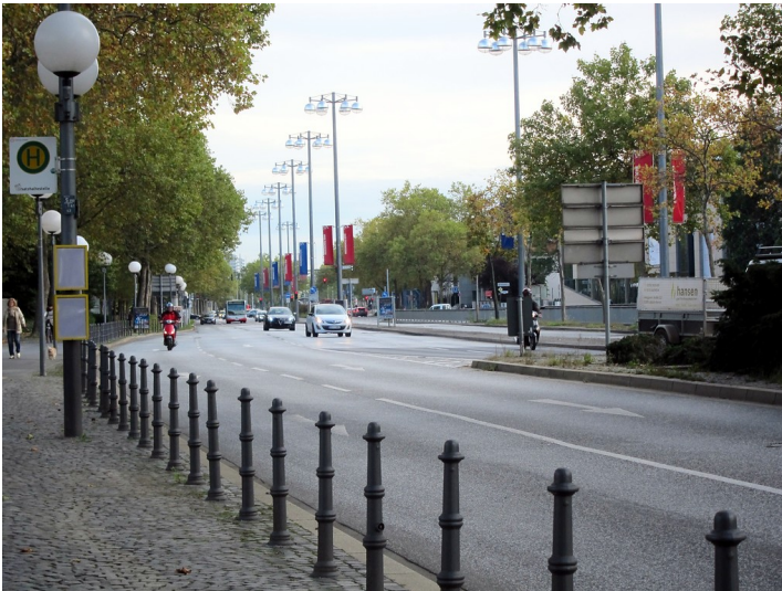
Blick in die Bonner Willy-Brandt-Allee vom Bundeskanzlerplatz aus gesehen (2014).