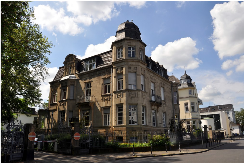
Wohnhaus Tempelstraße 8 im Bonner Regierungsviertel (2016)