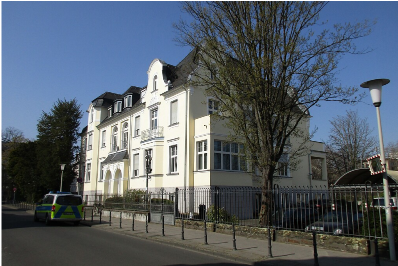
Blick auf das Wohnhaus Tempelstraße 1-3 (ehemals Wörthstraße) in Bonn-Gronau (2022).