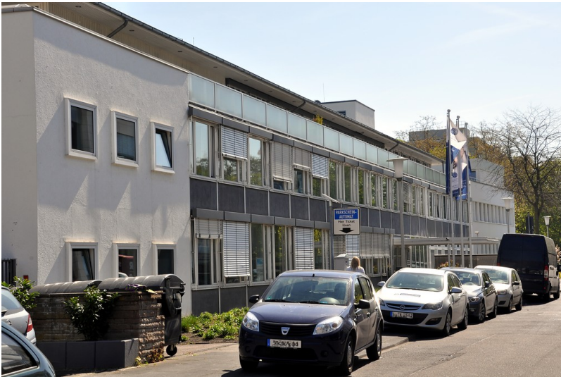
Schlegelstraße im Bonner Regierungsviertel mit dem Gebäude der ehemaligen Landesvertretung Bayerns beim Bund, heute Deutsche Stiftung Denkmalschutz (2015)