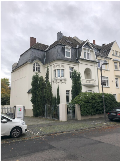
Wohnhaus, Rheinweg 1 in Bonn (2023)