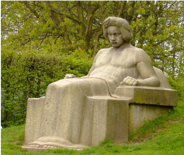
Das 1977 am Rande des Bundesgartenschauengeländes im Rheinauenpark in Bonn wieder errichtete Beethoven-Denkmal (2006)