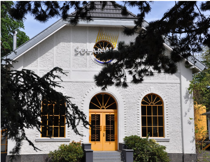
Wasserwerk Martin-Luther-King-Straße 24 in Bonn (2016)