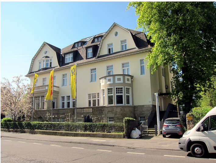
Villa Kurt-Schumacher-Straße 8/9 im Bonner Regierungsviertel (2015).