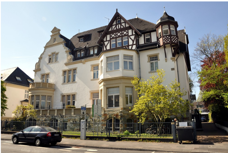
Villa in der Bonner Kurt-Schumacher-Straße 4-6 (2015)