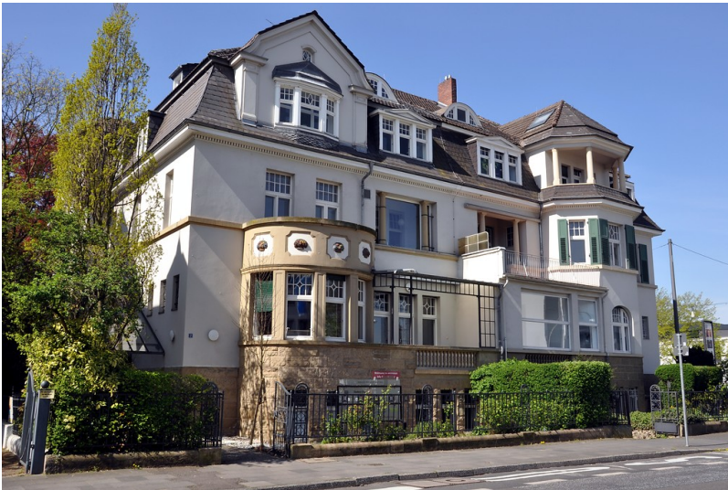
Doppelvilla Kurt-Schumacher-Straße 2 (links) / Heussallee 40 in Bonn (2015)