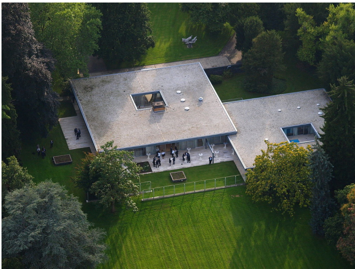
Luftaufnahme aus nordwestlicher Richtung mit dem Kanzlerbungalow am ehemaligen Bonner Sitz des Bundeskanzlers am Palais Schaumburg (2010)