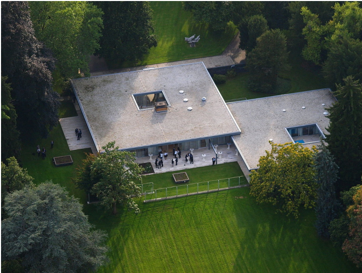
Luftaufnahme aus nordwestlicher Richtung mit dem Kanzlerbungalow am ehemaligen Bonner Sitz des Bundeskanzlers am Palais Schaumburg (2010)