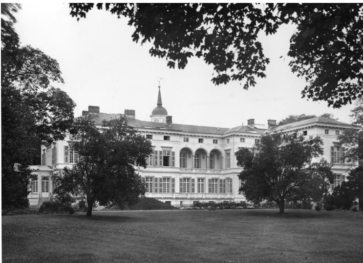
Historische Aufnahme des ehemaligen Bundeskanzleramts "Palais Schaumburg" in Bonn (1950), Ansicht von Osten aus dem Park.