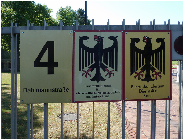
Beschilderung am Bundeskanzleramt in Bonn (2016)