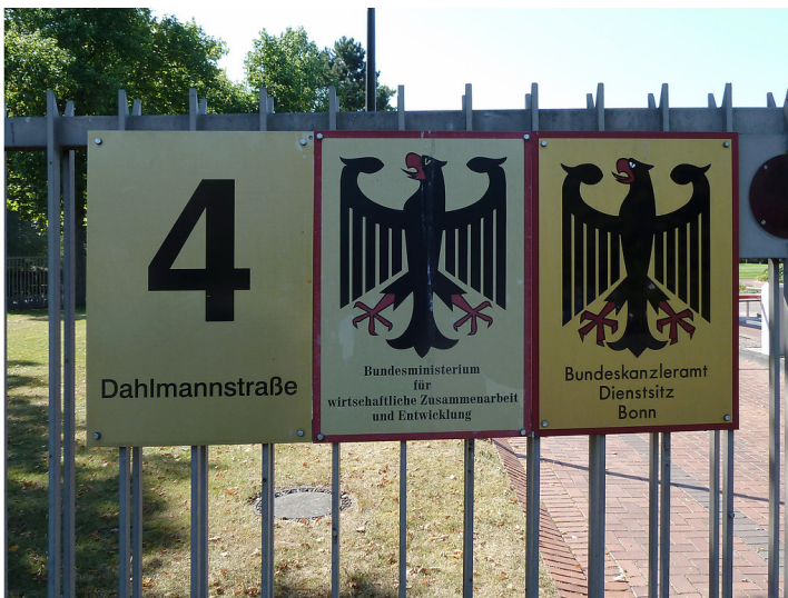
Beschilderung am Bundeskanzleramt in Bonn (2016)