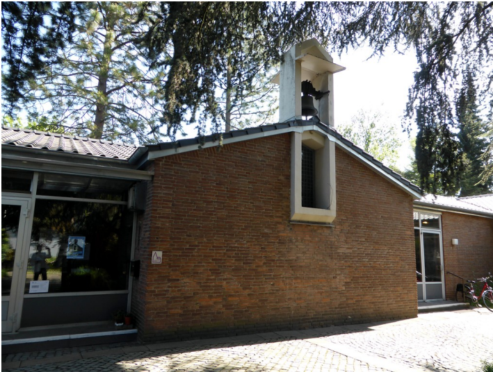
Thomaskapelle in Plittersdorf, Teilansicht des Gebäudekomplexes (2016)