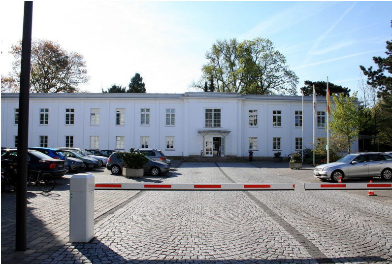
Verwaltungsgebäude Kaiser-Friedrich-Straße 16 im Park der Villa Hammerschmidt, heute Bundeskartellamt (2015)