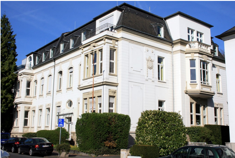
Wohnhaus Kaiser-Friedrich-Straße 11/13 in Bonn (2015).