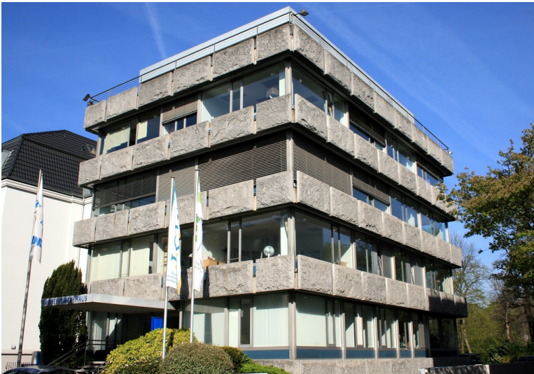
Gebäude der ehemaligen Kanzlei der Belgischen Botschaft, Kaiser-Friedrich-Straße 7 in Bonn (2015)