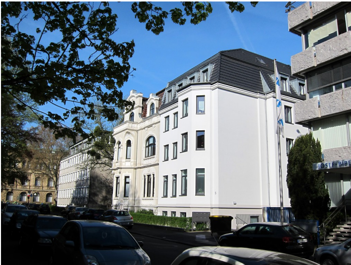
Wohnhäuser Kaiser-Friedrich-Straße 3 und 5 (vorne) im Norden des Bonner Regierungsviertels (2015).