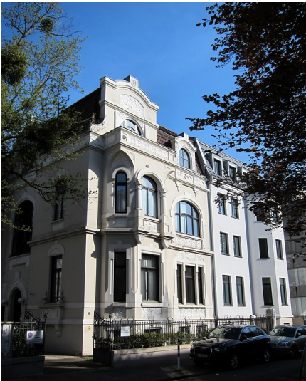
Wohnhaus in der Kaiser-Friedrich-Straße 3 im Norden des Bonner Regierungsviertels (2015).