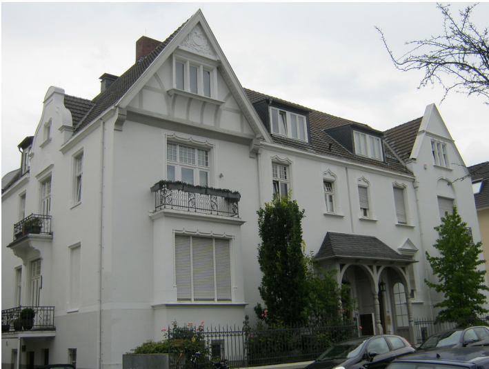
Gästehaus der ehemaligen Landesvertretung Berlin in der Joachimstraße 6-8 im Jahre 2011