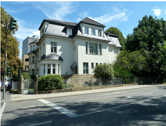
Wohnhaus Heussallee 18/20 in Bonn, Ansicht von Westen (2017).