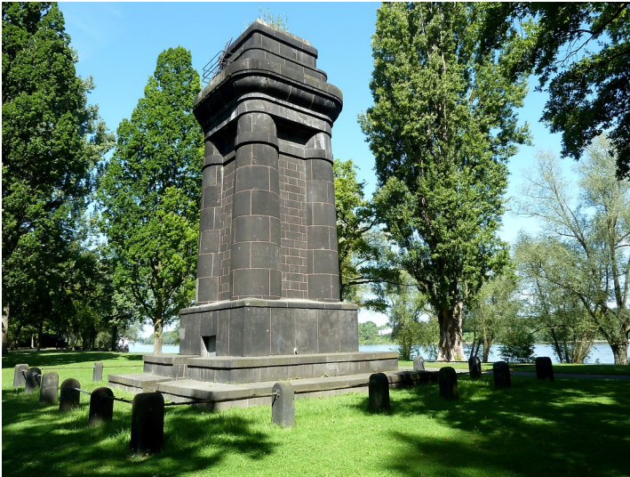
Bismarckturm am Heimkehrerweg (2017)