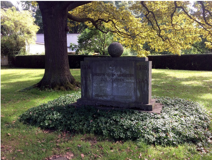
Kriegerdenkmal am Heimkehrerweg im Bonner Regierungsviertel (2017)