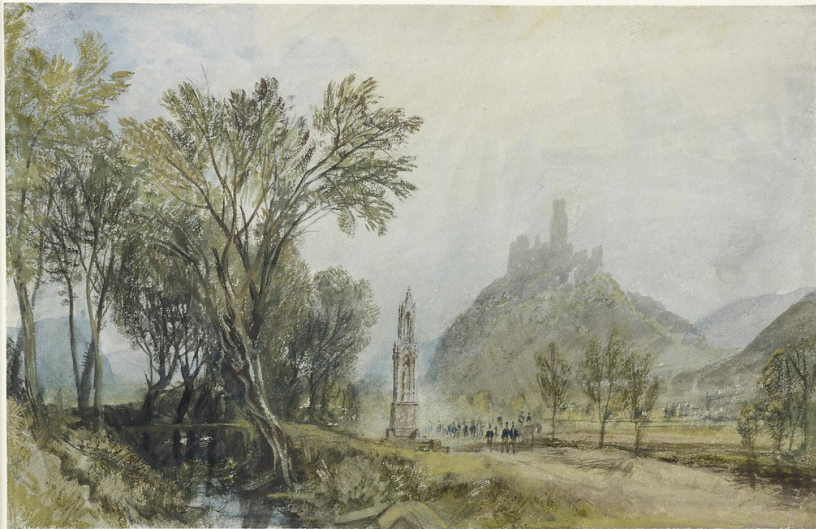
Aquarell des Hochkreuzes nahe Bonn-Bad Godesberg um 1817 von William Turner.