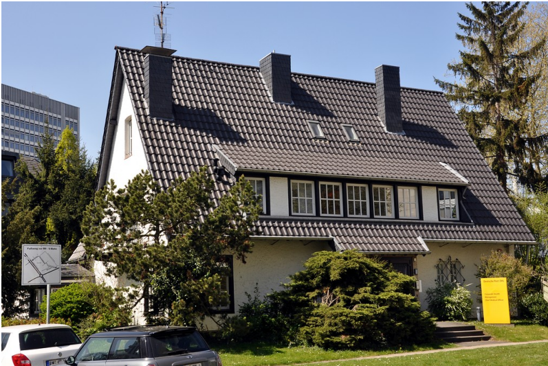
Das Wohnhaus Fritz-Schäffer-Straße 15 im ehemaligen Regierungsviertel in Bonn (2015), Sitz des Bundesverbands der Betriebskrankenkassen