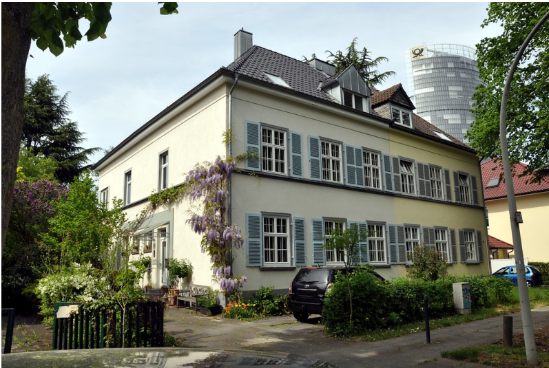
Doppelhaus Friedrich-Wilhelm-Straße 21-23 in Bonn (2016)