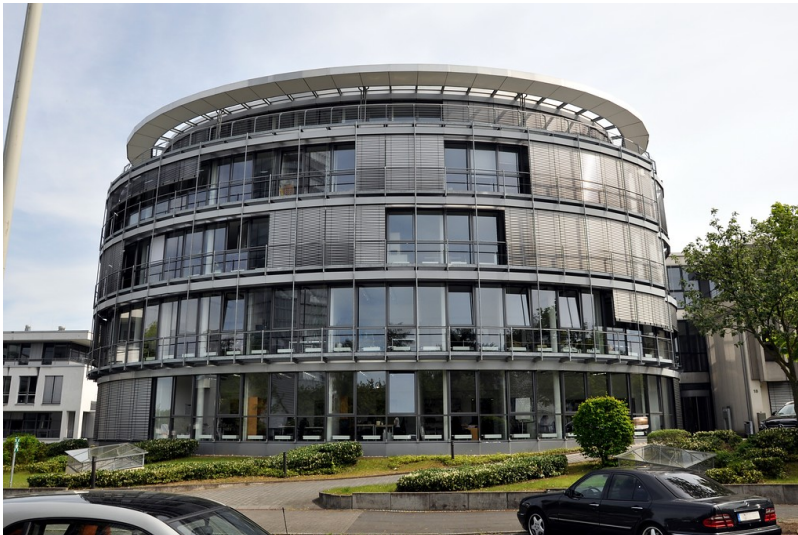
Kanzlei der Botschaft von Kanada, Friedrich-Wilhelm-Straße 18 in Bonn (2016)