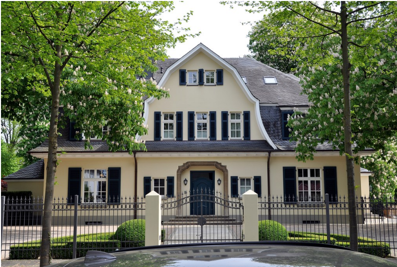
Wohnhaus Friedrich-Wilhelm-Straße 14-16 in Bonn (2016)