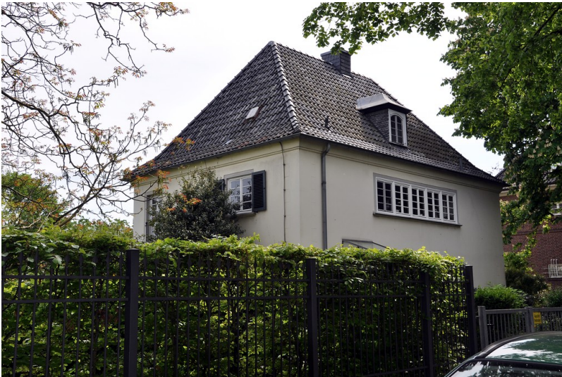
Wohnhaus Friedrich-Wilhelm-Straße 12 im Bonner Regierungsviertel (2016)