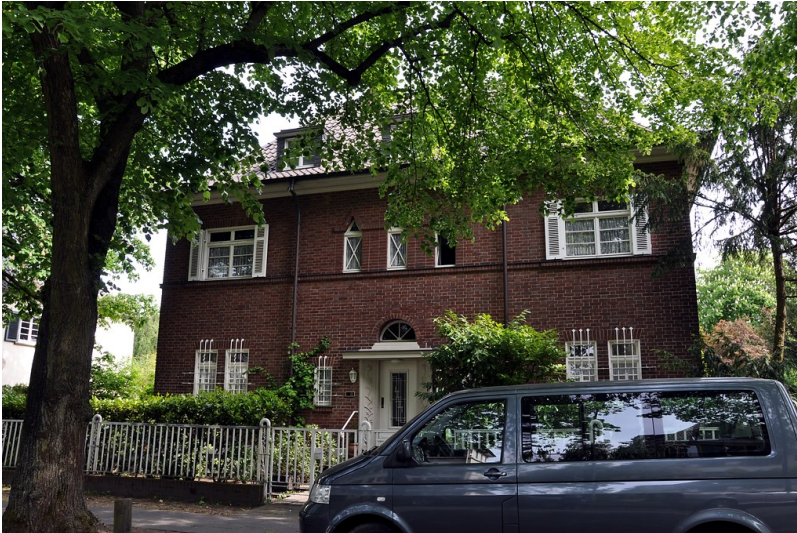
Wohnhaus Friedrich-Wilhelm-Straße 10 im Bonner Regierungsviertel (2016)