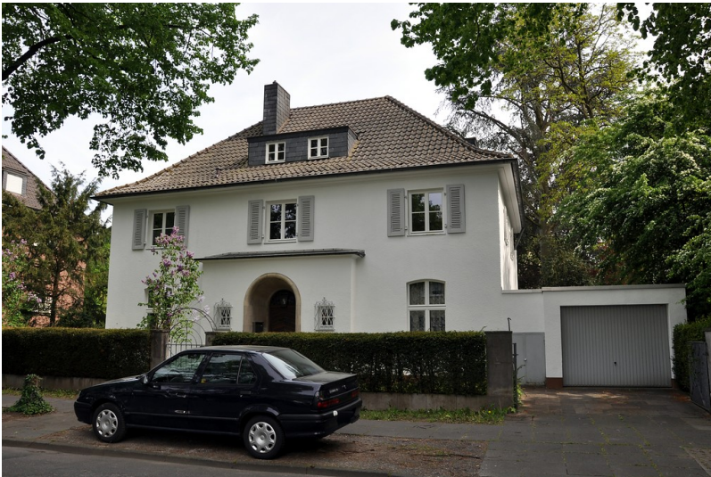
Wohnhaus Friedrich-Wilhelm-Straße 8 im Bonner Regierungsviertel (2016)