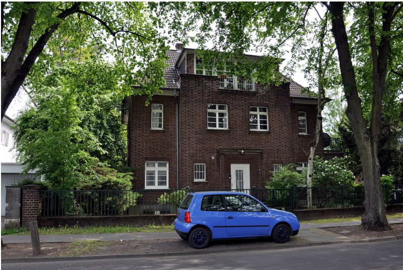
Wohnhaus Friedrich-Wilhelm-Straße 6 im Bonner Regierungsviertel (2016)