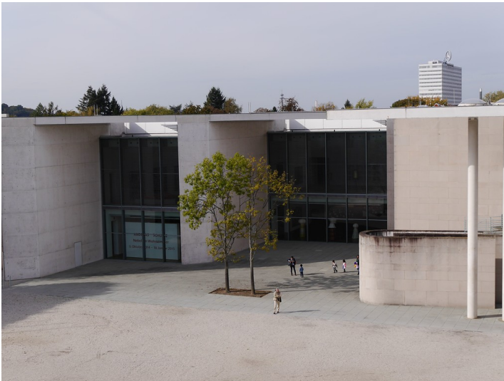
Teilansicht der Südostfront des Kunstmuseums Bonn (2014)