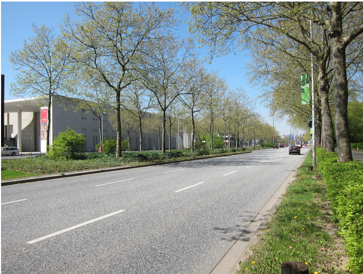
Die Friedrich-Ebert-Allee im Bonner Regierungsviertel auf der Höhe der Kunstmuseen mit Blickrichtung Norden (2015).