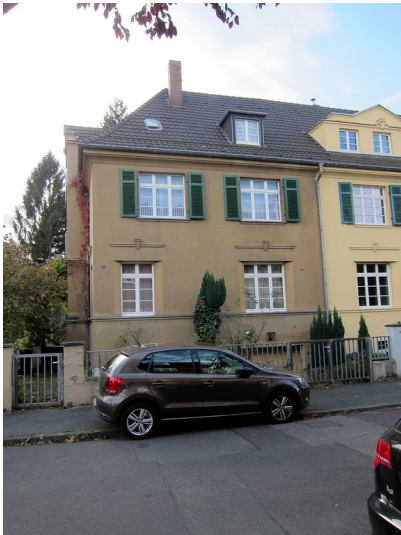
Frontansicht des Wohnhauses Eduard-Pflüger-Straße 54 in Bonn (2014)