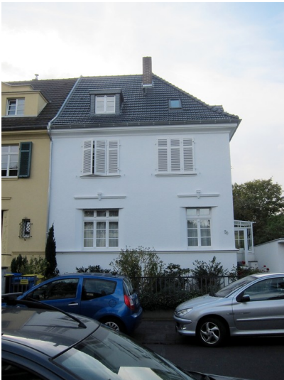
Frontansicht des Wohnhauses Eduard-Pflüger-Straße 50 in Bonn (2014)