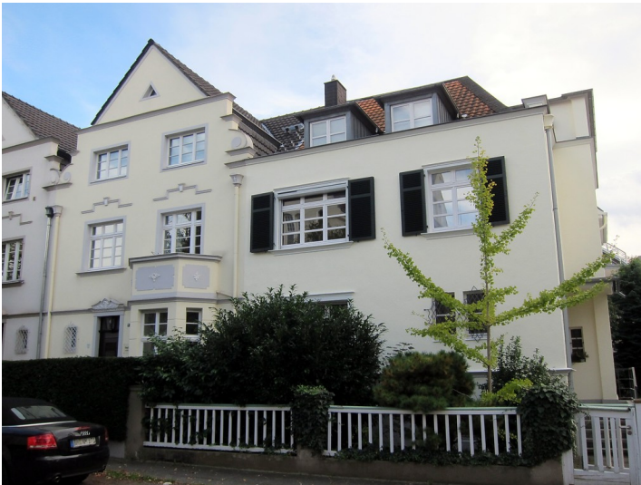
Wohnhäuser Coburger Straße 1b (linker Gebäudeteil) und 1c (rechter Gebäudeteil) in Bonn (2014)