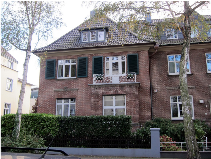
Frontansicht des Wohnhauses Coburger Straße 9 in Bonn (2014)