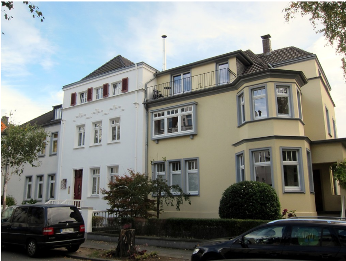
Wohnhäuser Coburger Straße 5 (linkes Gebäude) und 7 (rechtes Gebäude) in Bonn (2014)