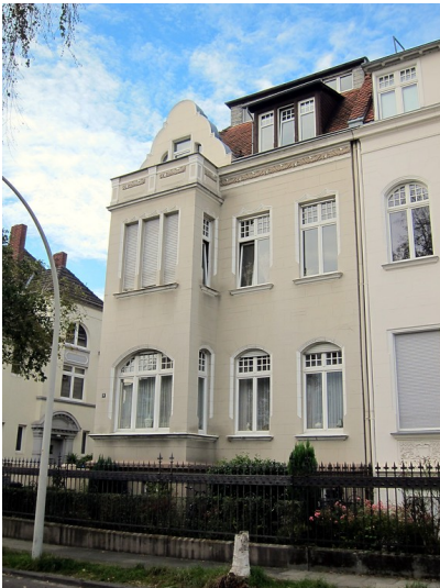
Frontansicht des Wohnhauses Coburger Straße 4 in Bonn (2014)