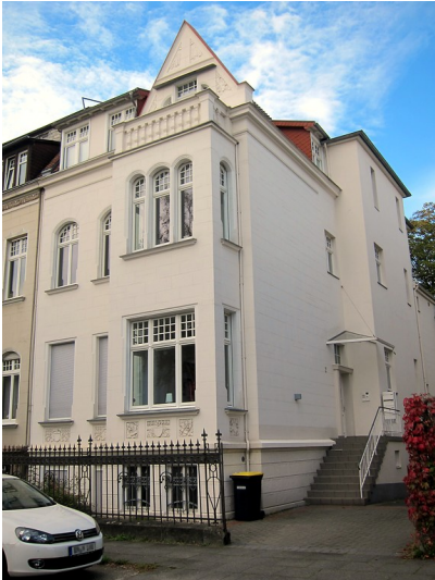
Wohnhaus Coburger Straße 2 in Bonn (2014)