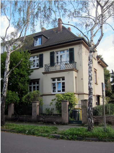
Wohnhaus Coburger Straße 27 in Bonn (2014)