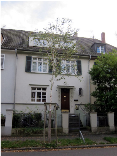
Frontansicht des Wohnhauses Coburger Straße 25 in Bonn (2014)