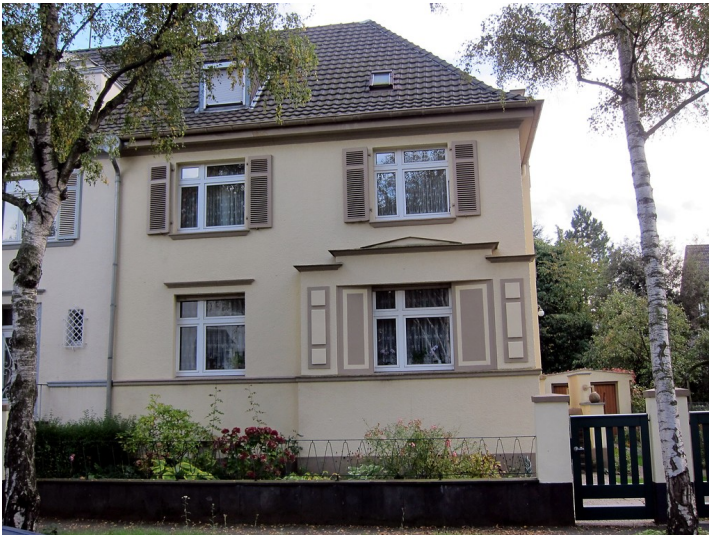
Frontansicht des Wohnhauses Coburger Straße 21 in Bonn (2014)