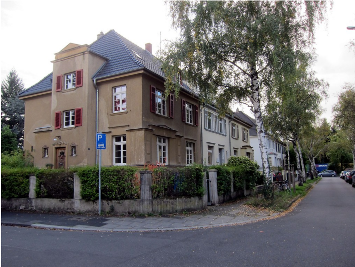
Wohnhaus Coburger Straße 17 in Bonn (2014)