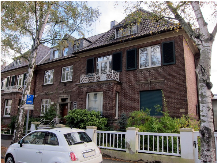
Frontseite des Wohnhauses Coburger Straße 13 in Bonn (2014)